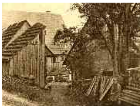
Haus Nr 4 und 5 (Bereich Cafe Bauer)

Versicherungsanschlag: (Gulden) 1500, Ölschläger- 1400. Dittus 100