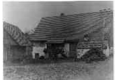
Haus Nr. 21