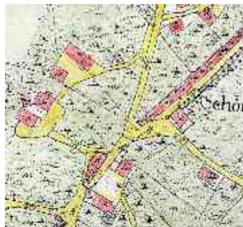
Abbildung 3 Detail Flurkarte

Detail Flurkarte, Haus Nr 54 -57, Bereich heutige Bergstraße