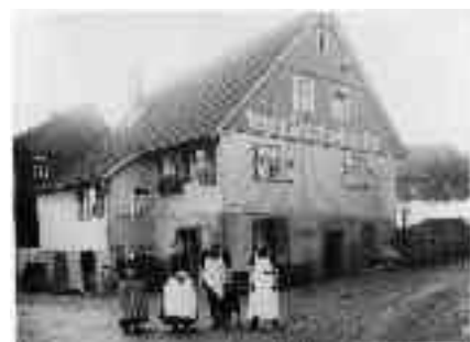
Bild nach 1900, heute Metzgerei Rentschler, rechts Weg zur heutigen Calmbacher Str.