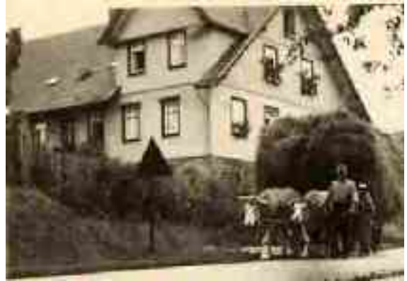
Haus Nr 54 , heute Bergstraße. Bild um 1950

Hochgebäude 6900 G. Incl. Inneneinrichtung wie Kirchenstühle und Altar, Die Uhr: 400 G die 2 Glocken 1200 G Die Orgel 1500 G (Gemeinde)