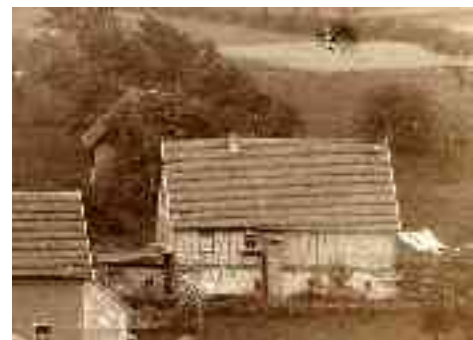
Scheuer Nr. 48a