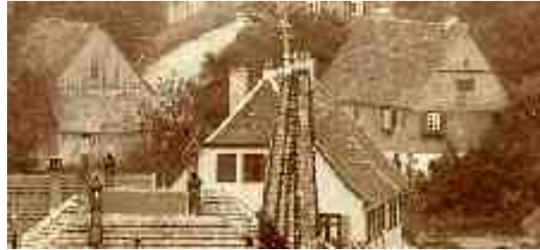
Abbildung 2 Haus Nr. 52 um 1900

Die Scheuer links ist nach 1857 entstanden, davor das Pfarrhaus, rechts hinter Pfarrhaus – Haus Nr 52